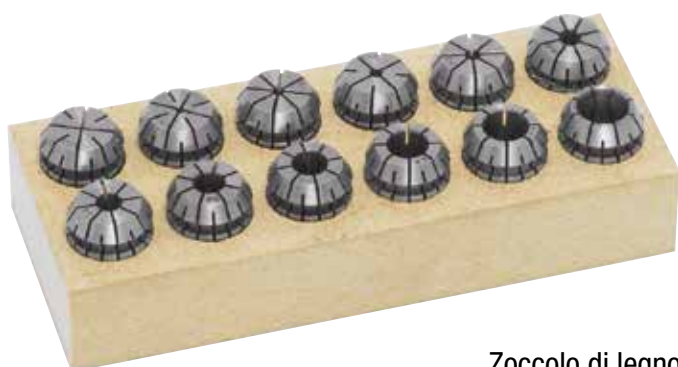
Zoccolo di legno