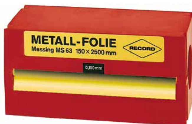
F30496 in ottone

Acquista 3 confezioni con il 20% di sconto