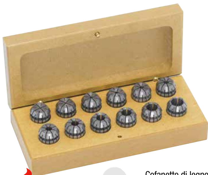
Cofanetto di legno

Acquista con il 5% di sconto ognuno degli assortimenti